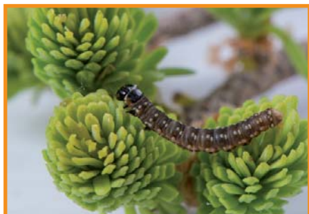
Tordeuse des bourgeons de l'épinette

Cet agent naturel de contrôle constitue la base de plusieurs formulations de biopesticides, dont l'efficacité a depuis longtemps été démontrée contre les chenilles de l'ordre des lépidoptères comme la tordeuse des bourgeons de l'épinette, la livrée des forêts, l'arpenteuse de la pruche, la tordeuse du pin gris et la spongieuse, pour en nommer quelques-unes.